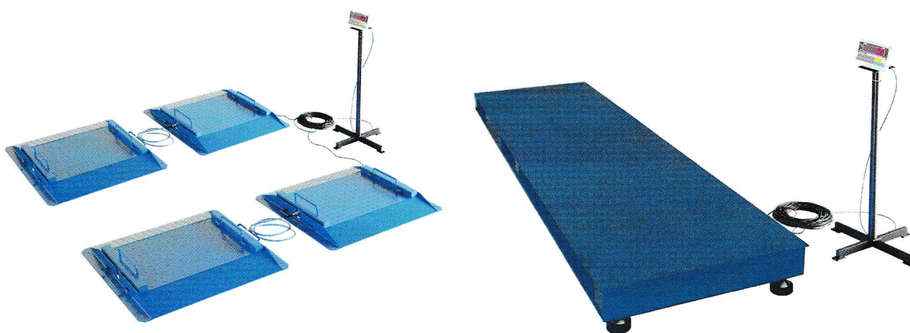
Рисунок 1 - Фотографии весов

Фотографии весов представлены на рисунке 1.